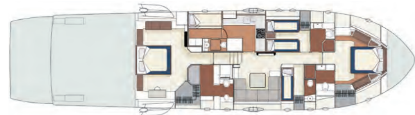
4 Cabins Layout