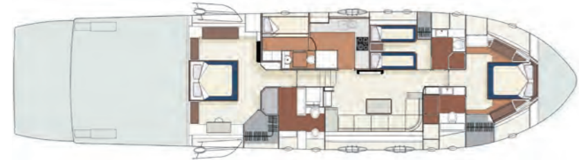
3 Cabins Layout