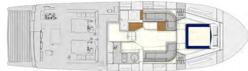
1 Cabin Layout