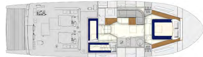
2 Cabins Layout